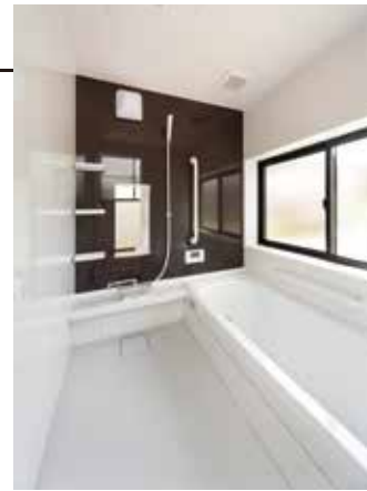
※ユニットバス(2013年8月)撮影

燃焼ともなうガスや水蒸気の排出がないから、空気をいつもクリーンに保つことができます。