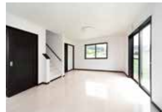
※リビングダイニング(2013年8月)撮影