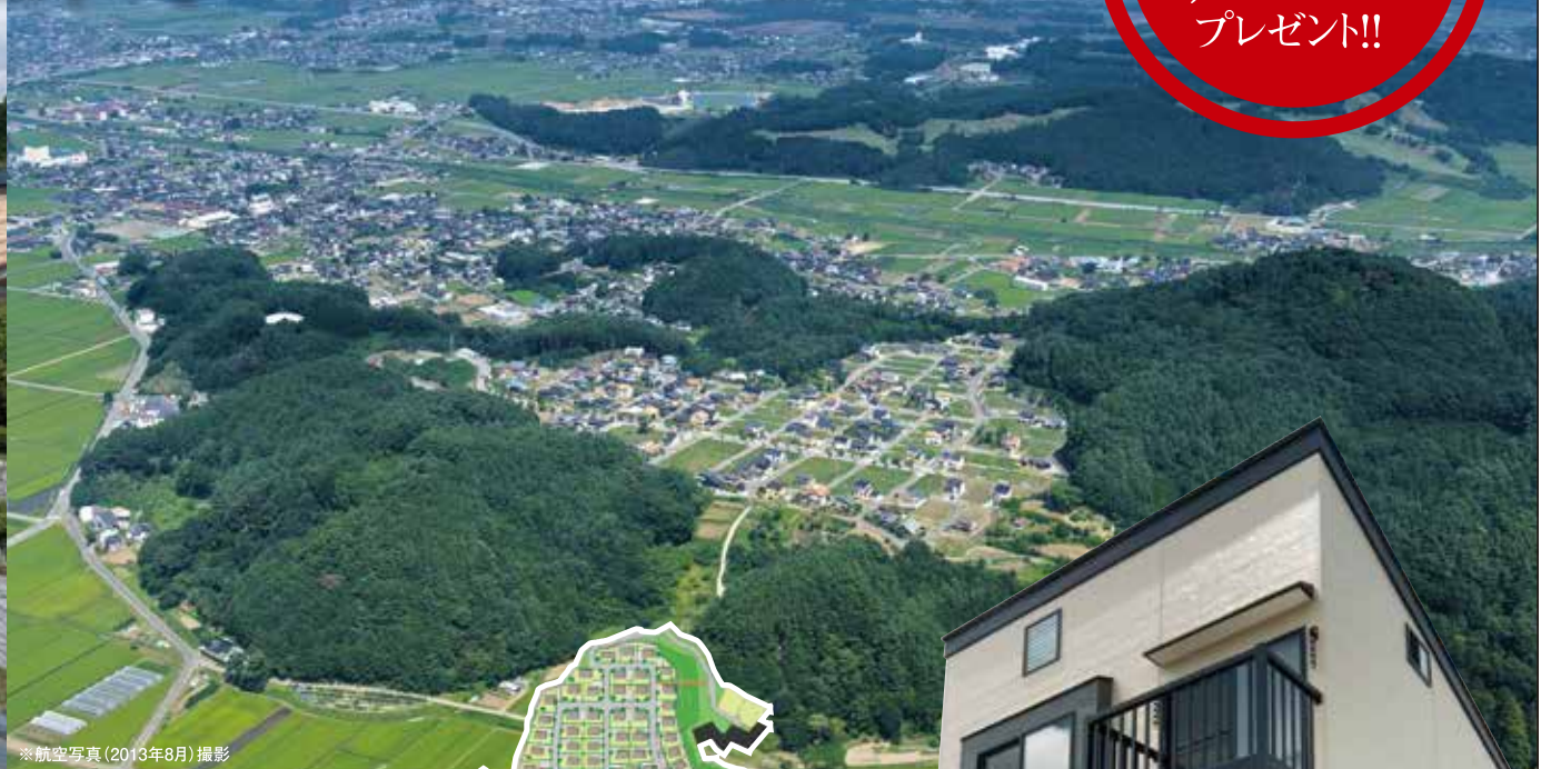
※タウン内(2013年8月)撮影 ※航空写真(2013年8月)撮影

公園や歩道が整備されコミュニティも構築された街。 今すぐ住みたいあなたも。じっくり好みの家を建てたいあなたにも。 アヴェニュー佐久平