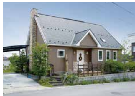
※タウン内(2013年8月)撮影