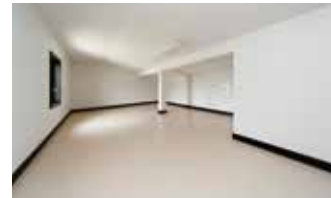
※屋根裏収納(2013年8月)撮影

たんすなどの収納を置いて、荷物を整理できます。普段使わないものや、季節ものなど大量にしまえてとても便利な空間です。