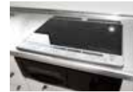
※IHクッキングヒーター (2013年8月)撮影